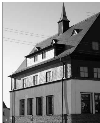
Ehem. Schulhaus A, Schulweg 7

Es werden Besichtigungstermine vergeben. Bitte melden Sie sich bei Martin Lohse,