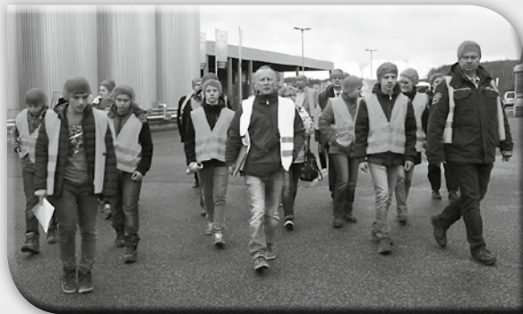
Eröffnung der Woche der offenen Unternehmen bei der Lichtenauer Mineralquelle, Foto: Jens Spreer