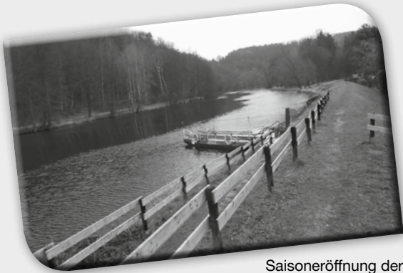
Saisoneröffnung der Historischen Querseilfähre Anna zu Ostern. Das Gelände entlang des Wanderweges erneuerte zuvor der Bauhof