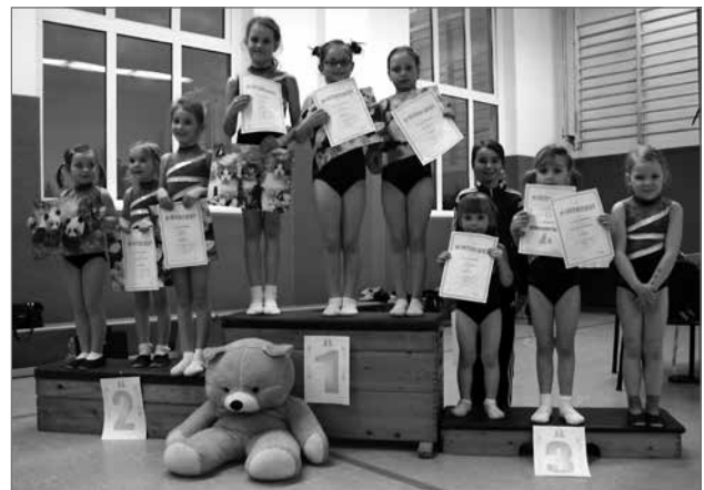
Unsere Starterinnen zum diesjährigen Osterturnen

Gründonnerstag war es wieder soweit. Die kleinsten Turnerinnen des Kreises trafen sich in Marbach um gemeinsam mit dem Osterhasen an die Geräte zu gehen. Dieses Jahr turnte der Osterhase sogar mit und zeigte den Mädchen, was sie den Kampfrichtern zum Wettkampf besser nicht zeigen sollten.